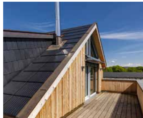
Projekt Bayreuth, Ludwigstr.