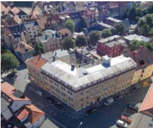
Projekt Bayreuth, Jahnstr.

Unser Antrieb ist es, heute so zu bauen, dass Ihre Immobilie auch morgen ihren Wert behält. Dabei steht immer der Mensch im Fokus unserer Arbeit – ganz gleich, ob Mitarbeiter oder Kunde.