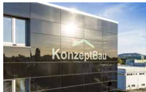
Stammsitz KonzeptBau GmbH

Die Spezialisierung auf Fachgebiete wie z. B. die Konzeption von Senioren-Quartieren bilden den Kern unserer Tätigkeit.